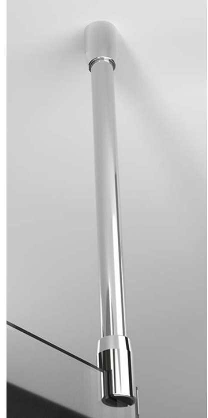
Barre Stabilisation Plafond